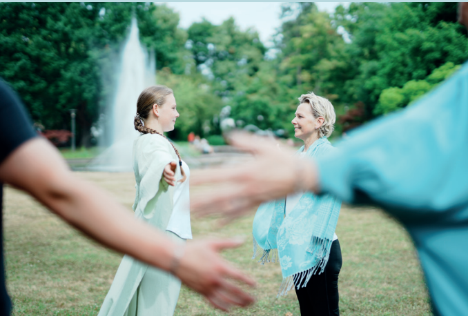
Gemeinsames Praktizieren und Reflektieren sind wesentliche Bestandteile von MBSR.

Mindfulness-Based Stress Reduction ist ein achtsamkeitsbasiertes und ganzheitliches 8-Wochen-Programm zur Stressbewältigung. In jeder Woche werden in jeweils 2,5 Std aufeinander aufbauend Themen zu Stressfaktoren, Körperempfindungen, Kommunikation und Selbstfürsorge besprochen. Übungen, Meditationsformen, Austausch und Reflexion begleiten die Themenschwerpunkte. MBSR eignet sich zur Reduktion aller Formen von Stress – unabhängig von der Ursache, z.B. bei allgemeiner Nervosität, bei Schlafstörungen, Bluthochdruck, Burnout-Prophylaxe, zur Stärkung des Immunsystems.